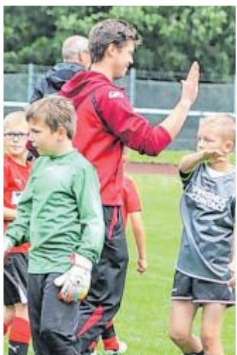
Fairplay: Der Gedanke soll über jedem Sieg und jeder Niederlage stehen.