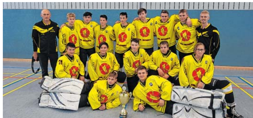
Spielen in der Bundesliga: Die Aufstiegsfotos zeigen die Inline-Hockey-Jugend (links) und die Junioren. In ihren Ligen wurden beide Mannschaften auch Fairplay-Sieger.

Neben dem Spaß am Spiel ist der Fairplay-Gedanke für den CSL Detmold von großer Wichtigkeit. „Jeder möchte gewinnen – ob beim Fußball, Hockey