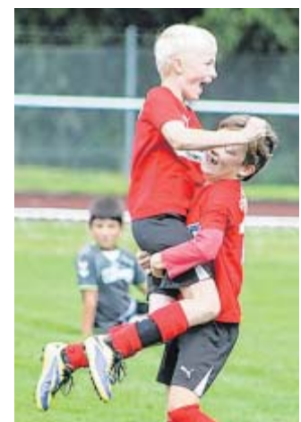
Haben Spaß: Insgesamt neun Jugendmannschaften stellt die Fußballabteilung.