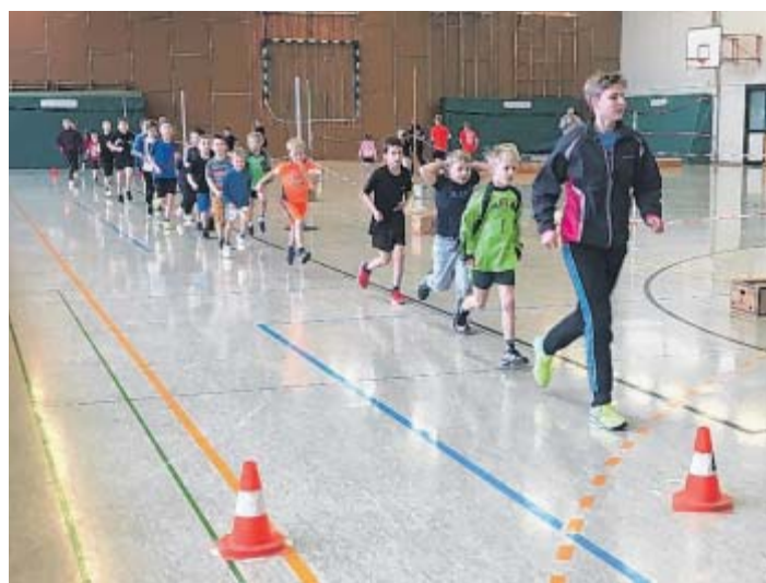
Wichtige Vorbereitung: Auch bei den Sportfest-Events für die Jüngsten steht zu Beginn Aufwärmtraining an.