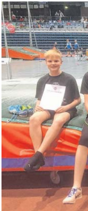
Mit Urkunden und viel Spaß: Bei div

sie in diesem Jahr zum 35. Mal. „Vor langer Zeit gab es einmal die Überlegung, ein Trainingslager im Süden zu veranstalten, doch dieser Gedanke wurde schnell verworfen“, so Starke. Und somit ist Norderney inzwischen zu einer Art zweiten Heimat der LG geworden. „Die Trainingsvoraussetzungen am Strand und auf dem großzügigen Gelände des Heimes mit seinem Kunstrasenplatz sind ausgezeichnet – dort fühlen sich alle wohl“, schwärmt Wilfried Starke. (gw)