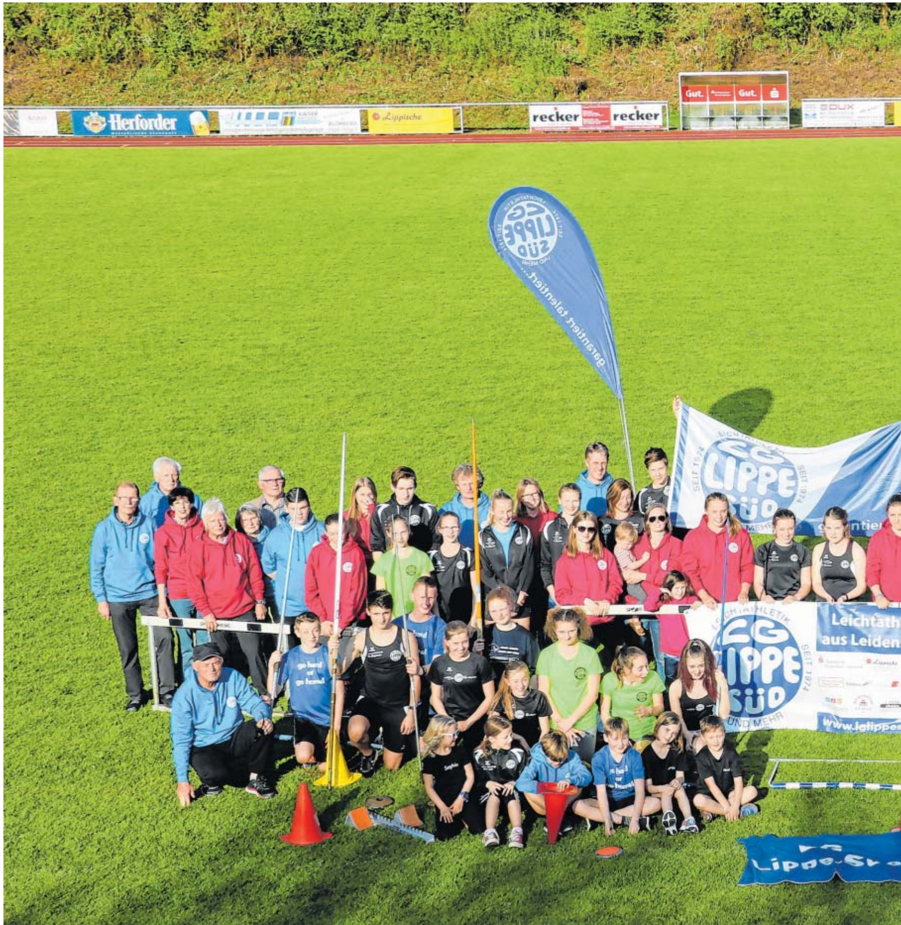
Eine starke Leichtathletik-Truppe: Mitglieder der LG Lippe-Süd aus verschiedenen Generationen stellen sich für den LZ-Fotografen auf.