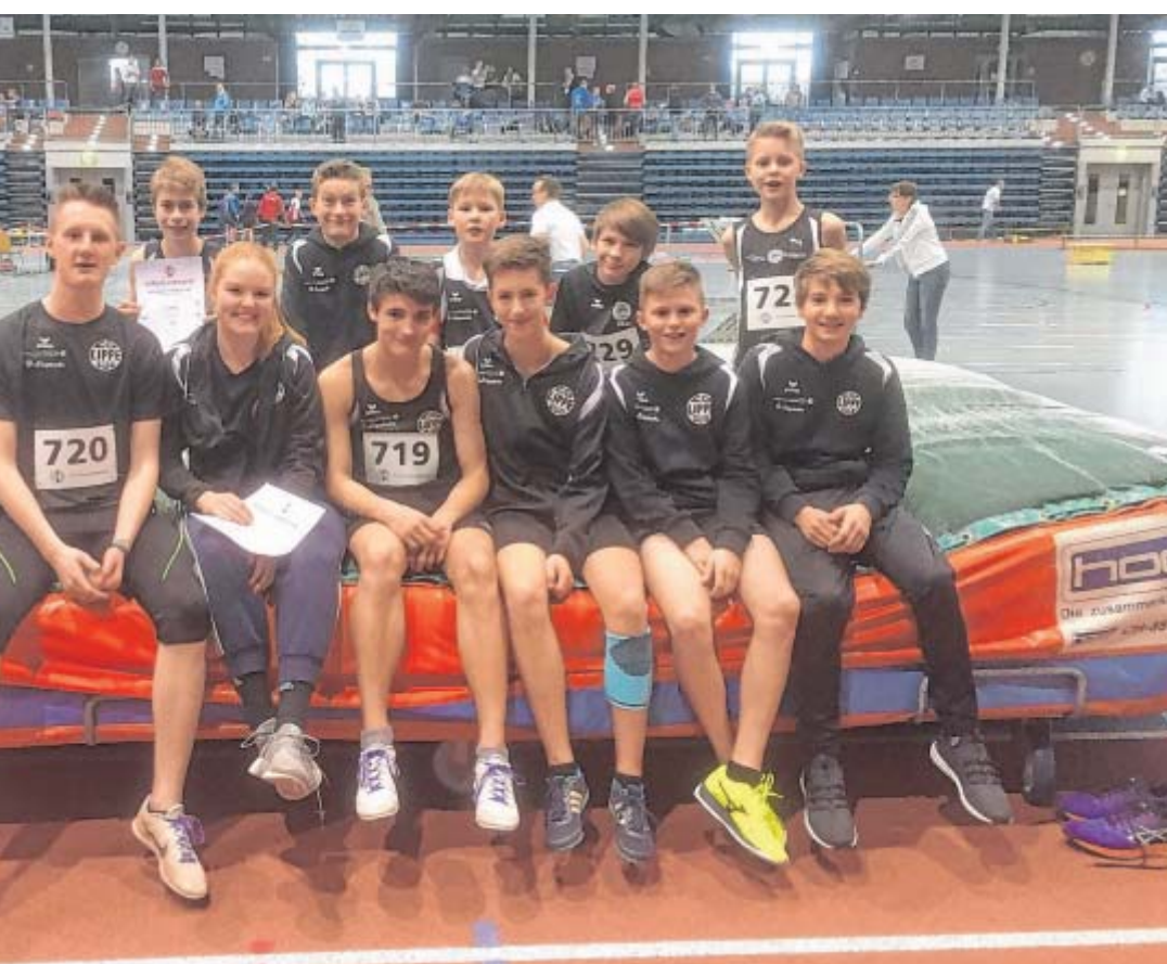
...erseren Sportfesten – drinnen wie draußen – gehen LG-Athleten an den Start.

...bestmögliche Trainings- und Wettkampfmöglichkeiten geboten werden. Die Früchte der Arbeit sind vielfältig, ... wie internationalen Meisterschaften bis hin zu den Olympischen Spielen