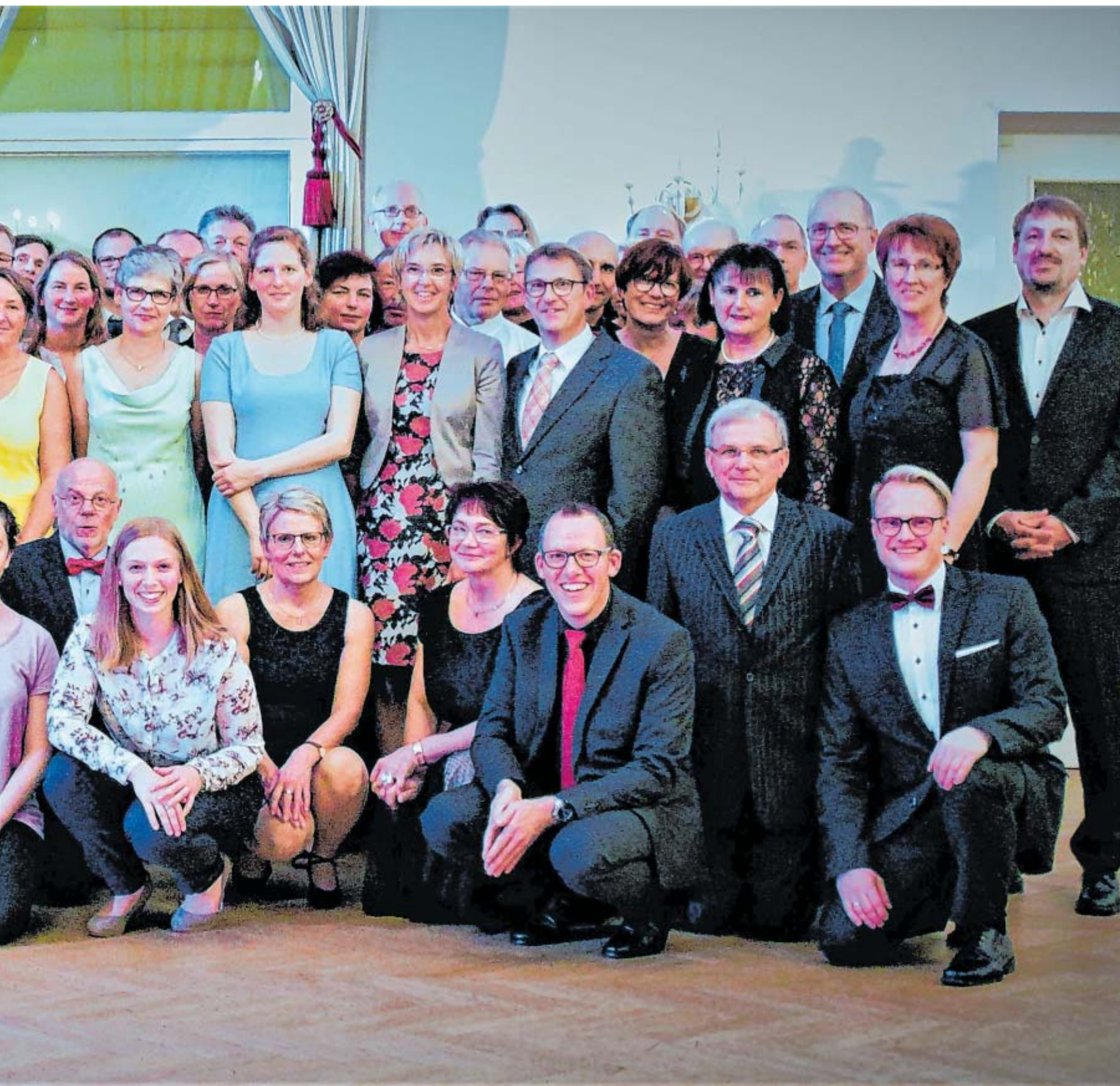
alle des Stadtgymnasiums.